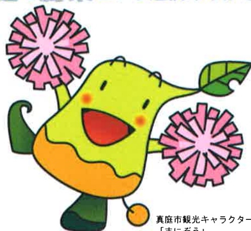
真庭市観光キャラクター 「まにぞう」